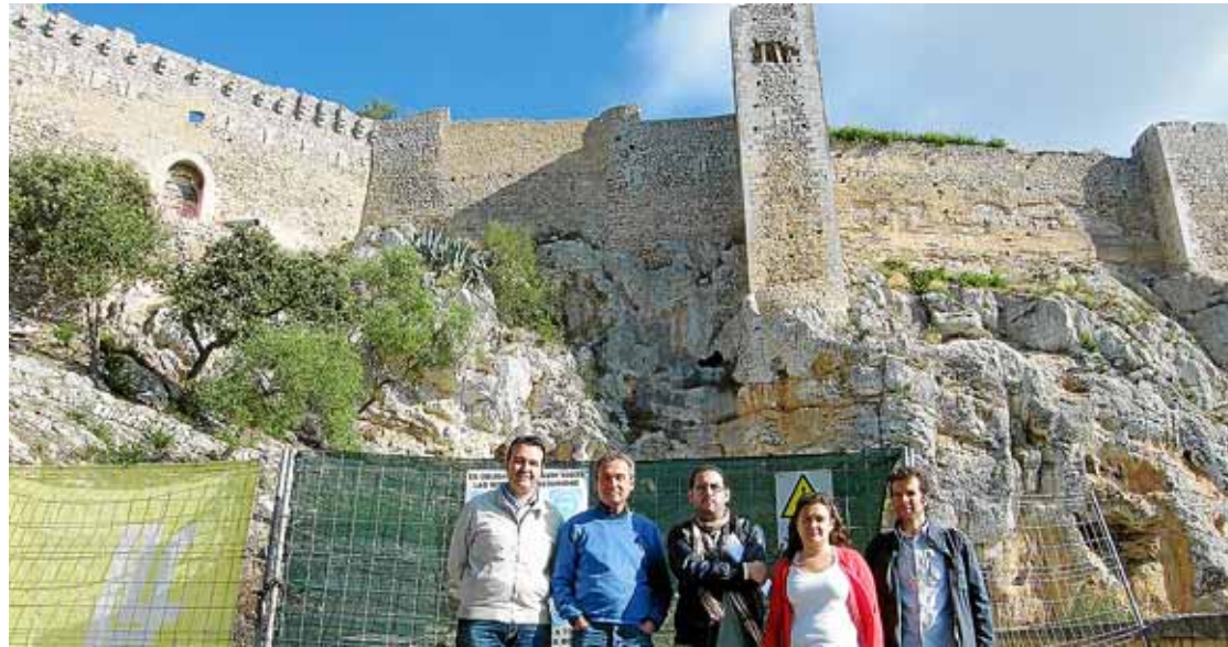
Representants del partit socialista mostraren el rebuig a la no-expropiació ahir dematí al peu de Santueri.

Santueri és un dels tres castells roquers que queden a Mallorca. Els socialistes varen assenyalar que presentaran mocions en els plens, que aquesta primera quinzena de novembre tindran lloc al Consell de Mallorca i a l'Ajuntament de Felanitx, perquè el procés d'expropiació començat a final de la legisla-