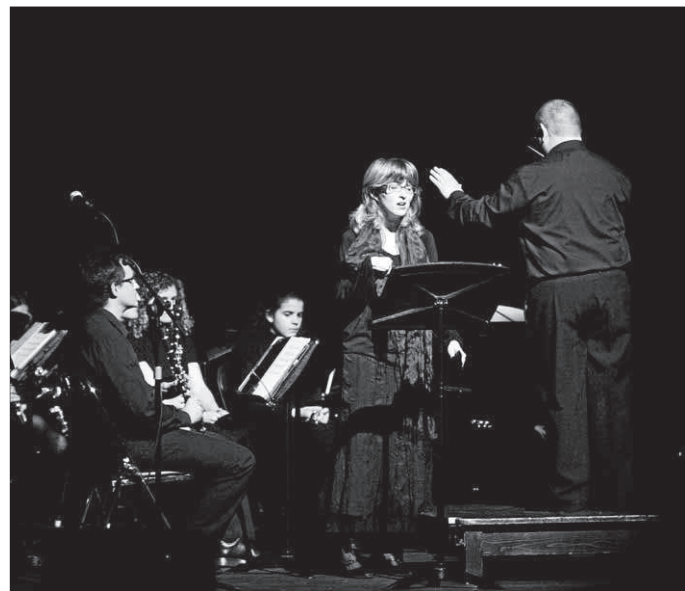
Un instante de 'Siau qui sou!', ayer en el Xesc Forteza.

mentos de ciencia ficción 952.000 euros, ocupa la tercera plaza, por debajo de Cisne negro , con 6 millones y medio amasados.