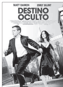
Los estrenos que más han recaudado.

Debut en el cine de animación de Gore Verbinski, artífice de la millonaria saga Piratas del Caribe , la comedia de aventuras Rango ha protagonizado un espectacular despegue taquillero. En los cines españoles congregó a 227.000 espectadores, recaudando en su primer fin de semana cerca de un millón y medio de euros. En una semana repleta de estrenos (algunos ni siquiera han conseguido plaza entre los 10 títulos más vistos), destacan los buenos datos de Destino oculto , thriller romántico con ele-