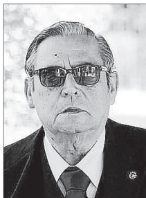
El escritor Alexandre Ballester.

En realidad, la trama de esta obra se centra en una pareja, ella actriz y él historiador, que se quedan recluidos en una casa de verano durante un temporal. La pareja, junto al resto de personajes, vivirá unos intensos días en los que tendrán que capear los temporales.