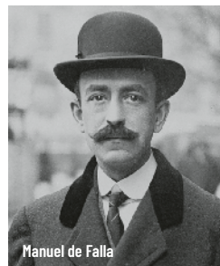
Manuel de Falla

Divendres 29 de setembre - 19.30 h Auditori de Manacor - 18 €