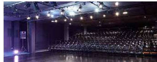
Teatre de Manacor