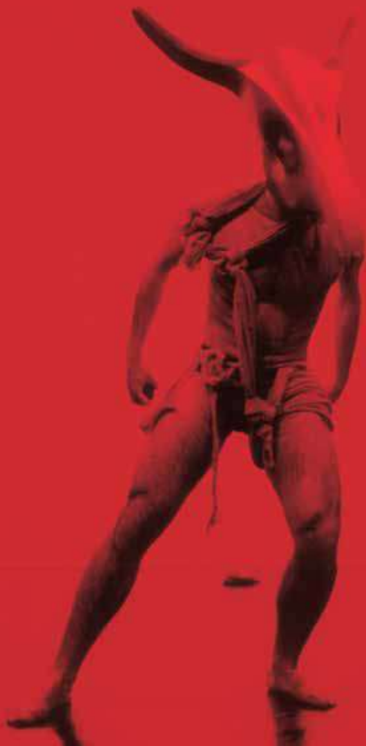
Fotografia portada: L'alegria que passa