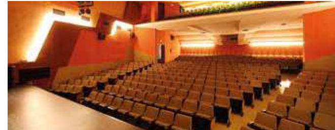
Teatre de Manacor