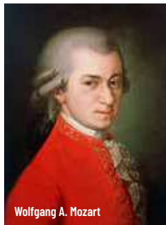
Wolfgang A. Mozart

Divendres 9 de febrer - 19.30 h Auditori de Manacor - 18 €