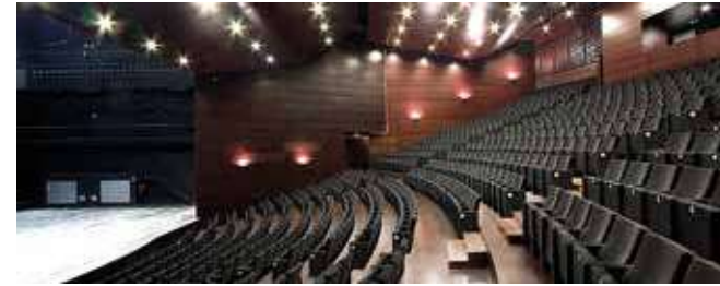
Auditori de Manacor