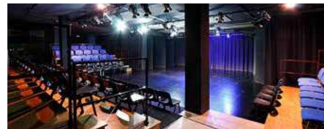
Teatre de Manacor